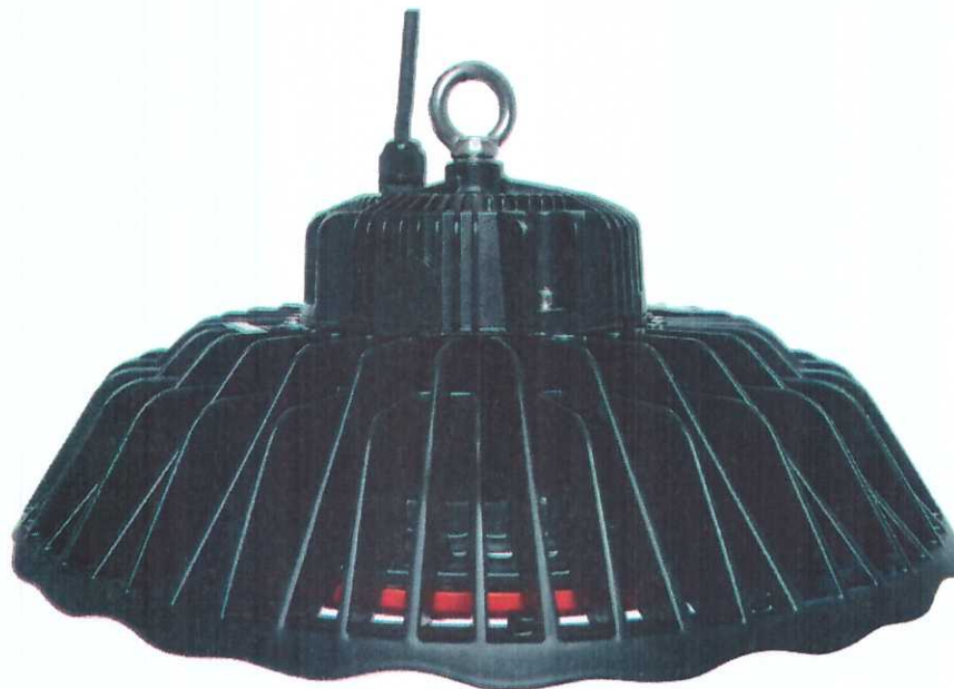
Рисунок 1 – Внешний вид изделия.

Результаты испытаний по настоящему протоколу относятся только к испытанным образцам. Настоящий протокол запрещается частично воспроизводить без письменного разрешения испытательной лаборатории.